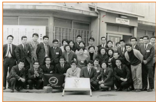
心斎橋事務所前で。初期の登録グループ「一粒の麦の会」

たとえばコミュニティの課題に直接関わる「ボランティアコーディネーション事業」では、地域ぐるみ的なアプローチに優先して、まず依頼者一人ひとりの生き方を支えることに重点をおく“個別対応”を基本としてきました。単に「社会的弱者」の支援というレベルにとどまらず、様々なハンディをもちながら生きる人々の“個”を尊重し、“違い”を認め合う社会作りの一環として、相談調整活動に取り組んでいます。