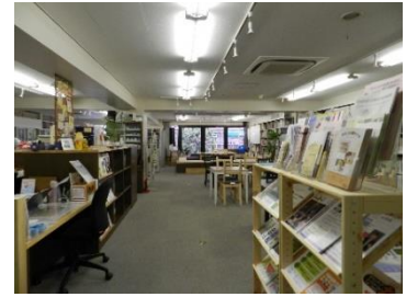
▲「CANVAS谷町」入口風景 会議室はこの右側です。

◎「CANVAS谷町」は、パートナー登録団体、および協会個人会員のご利用が優先されますが、一般の個人・企業・団体もご利用いただけます。