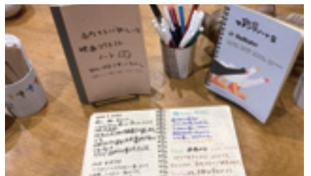
テーブルには利用者が思い思いの言葉を書くノートがある