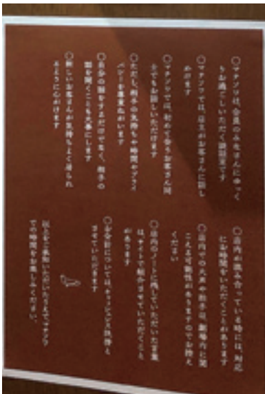
入口脇に掲げられた「会員のしおり」