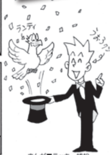
まんが ■ラッキー 福松