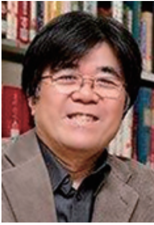
1953年鹿児島県生まれ。京都市社会福祉協議会・立命館大学産業社会学部教授を経て現職。男性介護者と支援者の全国ネットワーク代表、日本ケアラー連盟代表理事を務める。

福祉や介護、教育等の領域で新たなケア政策の潮流が生まれている。2020年3月に埼玉県が全国に先駆けて実現した「ケアラー支援条例」に端を発した自治体における同種の条例化の動向だ。いまこの条例は、私の活動現場である京都市はじめ全国36自治体（8道県・2政令市・26市町）に広がっている。「ケアラー」とは誰のことを言うのか。京都市の条例は「高齢、身