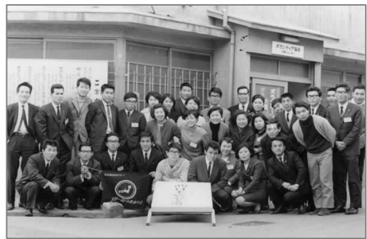
心斎橋事務所前。初期の登録グループ「一粒の麦の会」

たとえばコミュニティの課題に直接関わる「ボランティアコーディネーション事業」では、地域ぐるみ的なアプローチに優先して、まず依頼者一人ひとりの生き方を支えることに重点をおく“個別対応”を基本としてきました。単に「社会的弱者」の支援というレベルにとどまらず、様々なハンディをもちながら生きる人々の“個”を尊重し、“違い”を認め合う社会作りの一環として、相談調整活動に取り組んでいます。